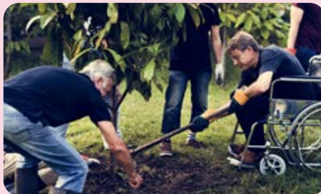
Llun: Gwirfoddolwyr yn plannu coeden

Mae'r ymchwil hefyd yn awgrymu bod gan y sector gryn ffordd i fynd eto i ddenu pobl o gefndiroedd amrywiol ac sydd ag anghenion amrywiol.