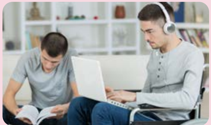
Llun: Dau unigolyn yn gwirfoddoli ar liniaduron

Mae estyn allan at wahanol bobl, gan gynnwys y rheini ag anghenion cymorth ychwanegol, yn creu diwylliant sy'n mynd ati'n rhagweithiol i hyrwyddo ac annog cydraddoldeb, amrywiaeth a chynhwysiant ac sy'n galluogi pobl i ddod â'u profiad, eu sgiliau a'u gwybodaeth i'w rolau gwirfoddoli ac i'r mudiad.