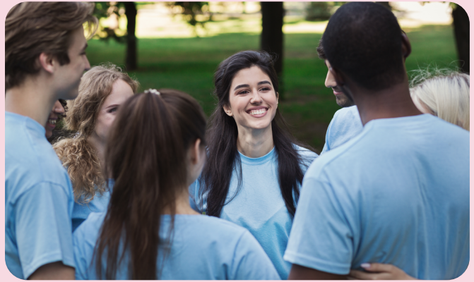
Llun: Grŵp o wirfoddolwyr yn gwenu

Dylech annog siaradwyr Cymraeg i'w siarad Cymraeg wrth wirfoddoli. Dangoswch fod eich mudiad yn gweld gwerth mewn siarad Cymraeg, er enghraifft drwy gael deunyddiau Cymraeg wrth law ac i'w harddangos a dangos pwy sy'n siaradwyr Cymraeg ( drwy ddefnyddio'r bathodyn laith Gwaith ) fel y bydd y cyhoedd, staff a gwirfoddolwyr yn gallu Siarad Cymraeg â nhw o'r dechrau.